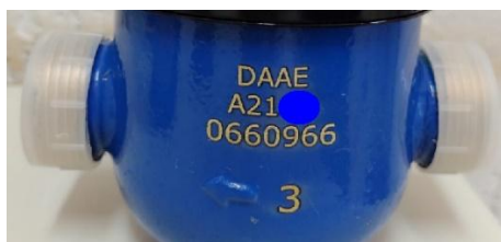
Foto 01 - Detalhe da inserção da sigla DAAE na carcaça do MEDIDOR