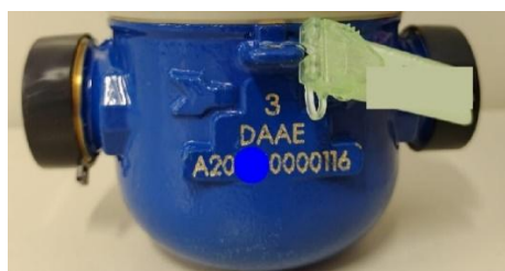
Foto 02 – Detalhe da inserção da sigla DAAE na carcaça do MEDIDOR.