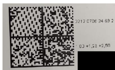
Foto 05 – Detalhe do QR- Code com os erros de indicação do medidor

d) Na Nota Fiscal deverá vir identificado a numeração dos medidores nos lotes enviados, bem como deverá conter nas embalagens, a numeração da referida Nota Fiscal;